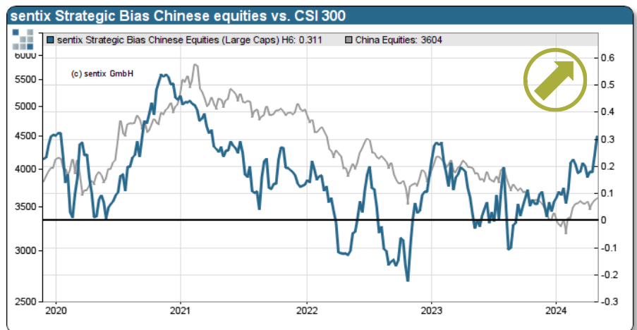
sentix Strategischer Bias Aktien China und CSI 300

Eine unserer Empfehlungen aus dem Jahresausblick 2024 punktet bei immer mehr Anlegern: Der Strategische Bias für den CSI 300 erreicht mit +31 Prozentpunkten den höchsten Wert seit April 2021. Erfreulicherweise zeigt die Stimmung mit +14 Prozentpunkten keine Überhitzung des Marktes an. Auch die übrigen Aktienmärkte können weiteres Vertrauen bei den Anlegern gewinnen. Während in vielen Aktienmärkten der Bias zulegt, bröckelt dieser bei den Renten. Auch die Konsolidierungen bei den Edelmetallen sowie bei Bitcoins verlaufen konstruktiv.